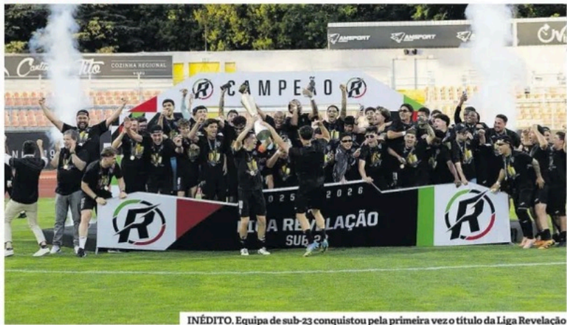
INÉDITO. Equipe de sub-23 conquistou pela primeira vez o título da Liga Revelação